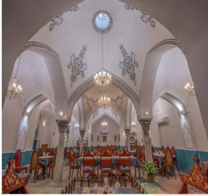
حمام گپ خرم آباد