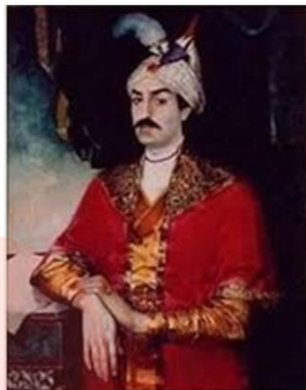
شاه اسماعیل اول صفوی

در نتیجه موفقیت های سیاسی و نظامی شاه اسماعیل، حکومت کشور ما یکپارچه، مستقل و نیرومند شد؛ به طوری که قلمرو آن به حدود قلمرو دوره ساسانیان رسید. حکومت صفوی همه اقوام ایرانی را زیر حاکمیت خود گرفت و موجب هم بستگی و اتحاد بیشتر ایرانیان شد.