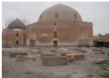
آرامگاه کشته‌شدگان جنگ چالدران

با وجود شجاعت زیاد شاه اسماعیل و سربازانش، ایرانی‌ها در جنگ چالدران شکست خوردند. پس از جنگ چالدران، تبریز به اشغال عثمانی‌ها در آمد اما مقاومت و مبارزه مردم آن‌ها را وادار به عقب نشینی کرد.