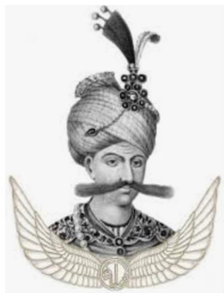
شاه عباس یکم صفوی

پس از شاه اسماعیل پسرش، تهماسب ، به حکومت رسید. او با سر و سامان دادن به اوضاع داخلی و دفع حمله‌های ازبکان و دولت عثمانی، موفق شد حکومت صفوی را تثبیت و تحکیم کند. شاه تهماسب پایتخت را از تبریز به قزوین انتقال داد؛ زیرا تبریز همواره در معرض هجوم سپاه عثمانی بود.